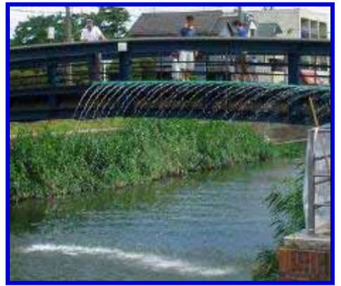
「浦安アオギス祭り」の将来イメージ